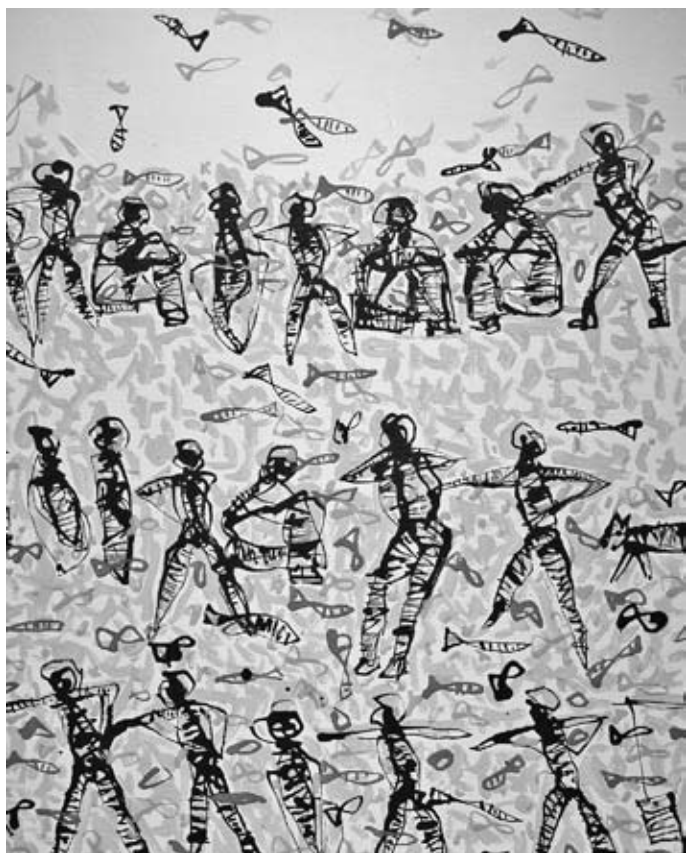
Người ăn không khí - Tranh LÊ THÁNH THU