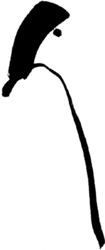
Nàng 2 - Tranh LÊ KÝ THƯƠNG