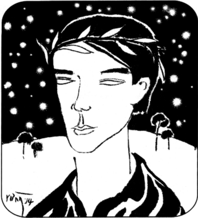
Thi sĩ - Tranh RỪNG