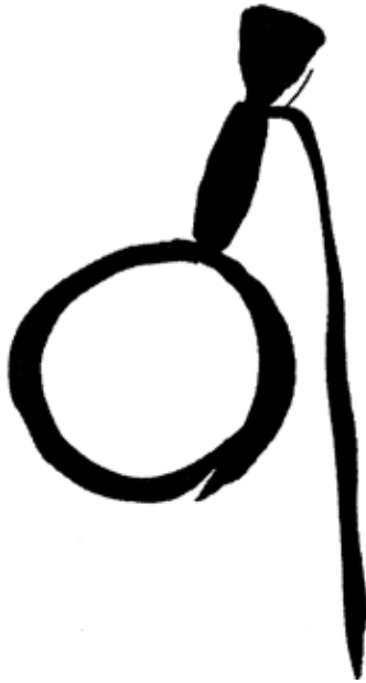
Nàng 1 - Tranh LÊ KÝ THƯƠNG