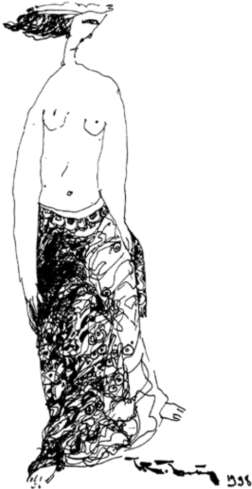
Nàng thơ - Tranh TRỊNH THANH TÙNG