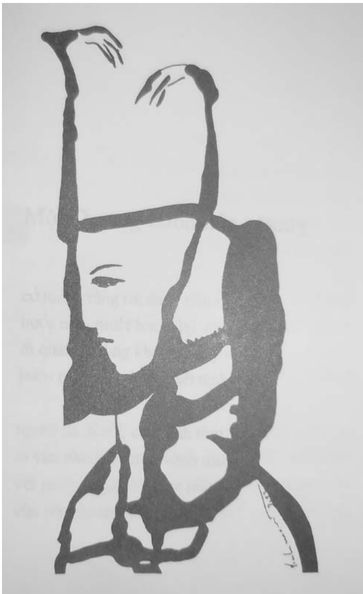
phụ bản Đinh Cường