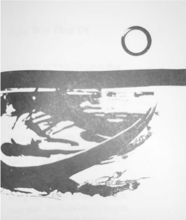
phụ bản Đinh Cường

thứ 4 trà rượu mười vòng thả bước tìm hứng quanh phòng khách vuông thứ 5 mỗi hết uống sông ngà ngà đặng cái nhớ thương muôn đời thứ 6 mượn rượu đẩy hơi không thành thơ cũng thành lời vu vơ thứ 7 đời đẹp hơn thơ có rượu có bạn dzô dzô cụng hoài chủ nhật cũng phải lai rai để mà lấy hứng trả bài cho em