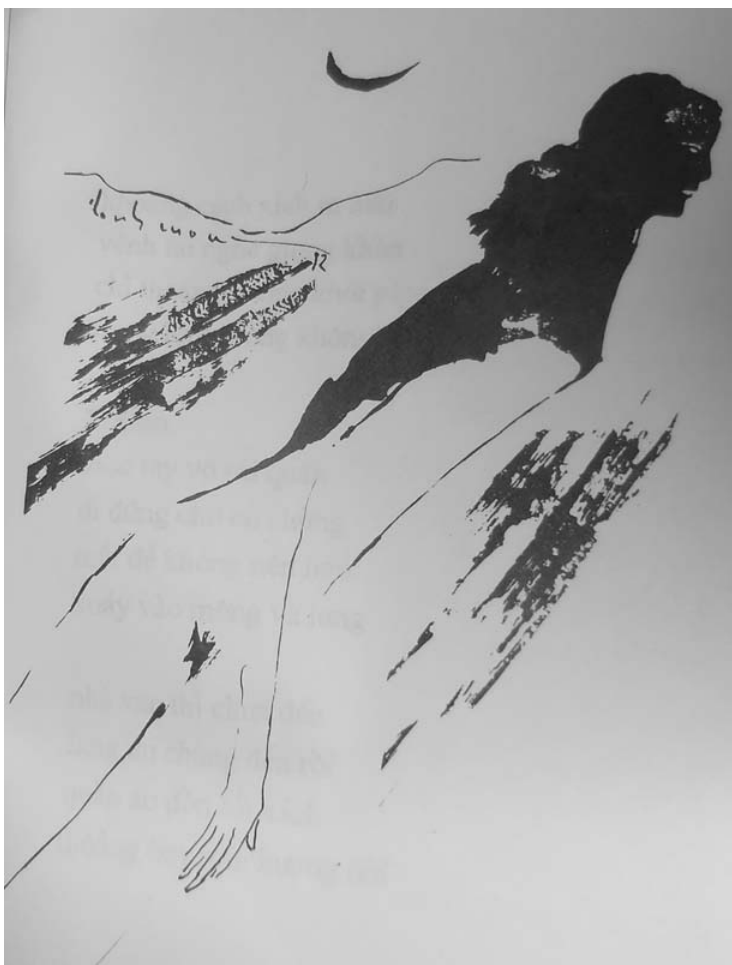
phụ bản Đình Cường

rót đi, ừ cứ rót phá giới vì bạn vàng đừng run tay hiền hữu rượu mở bừng giác quan