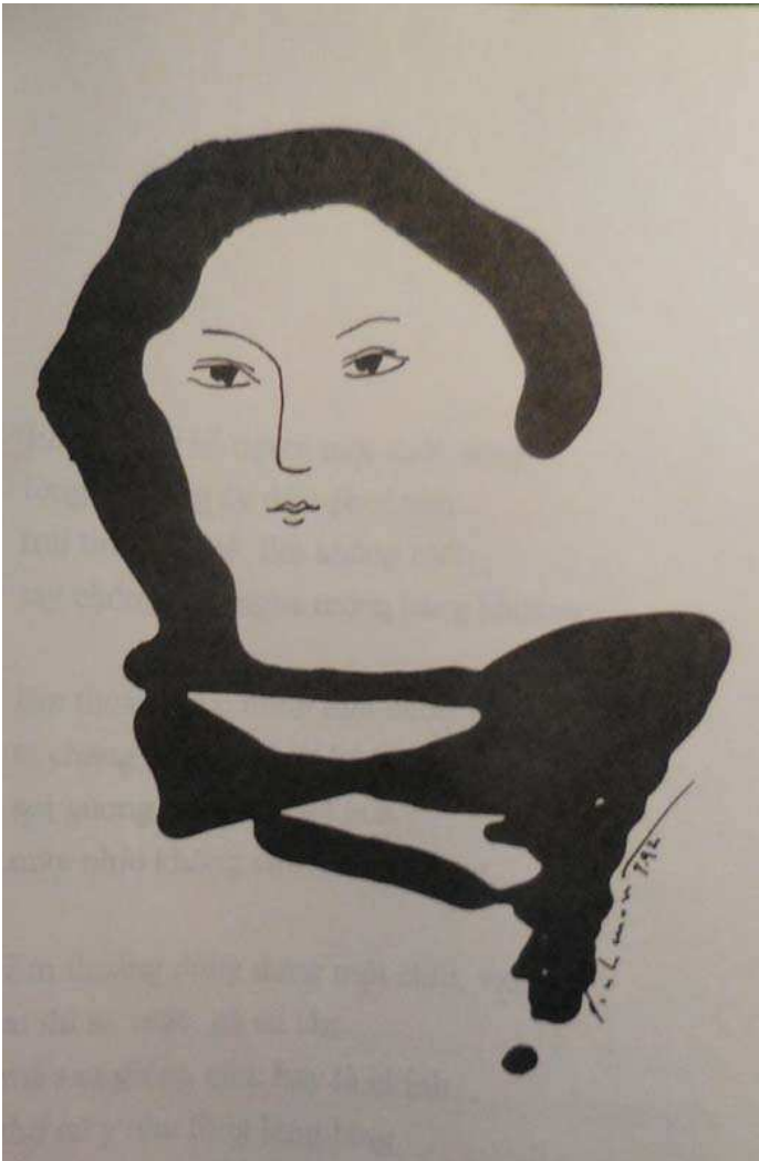
phụ bản Đinh Đường

Em của tôi, không chỉ một người mà là tất cả các giai nhân trái tim đủ chứa tôi cư ngụ sống một đời thơ. một cõi tâm