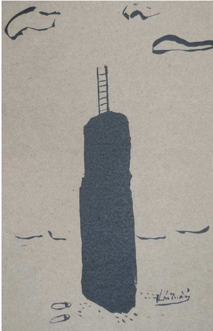
phụ bản Thái Tuấn