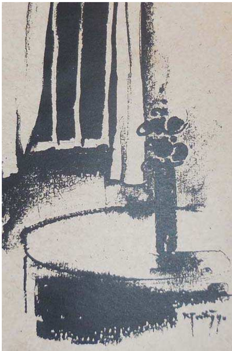
phụ bản Khánh Trường