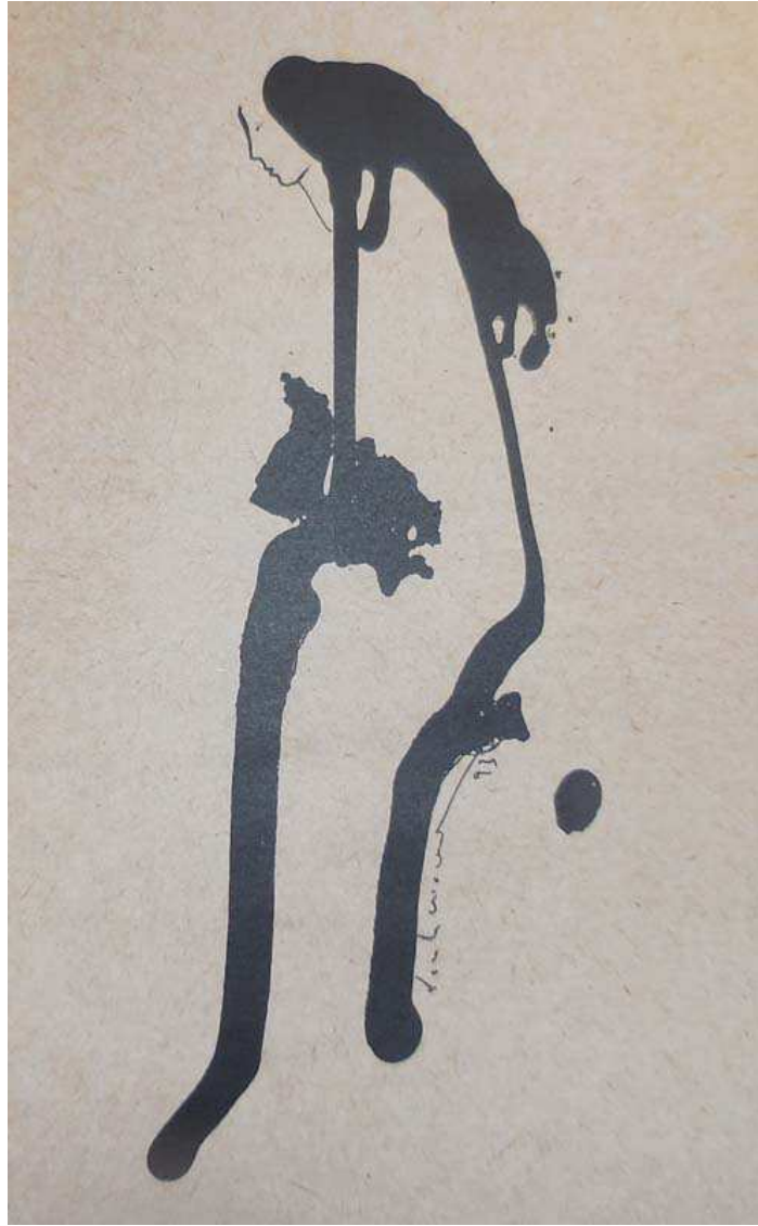
phụ bản Đinh Cường